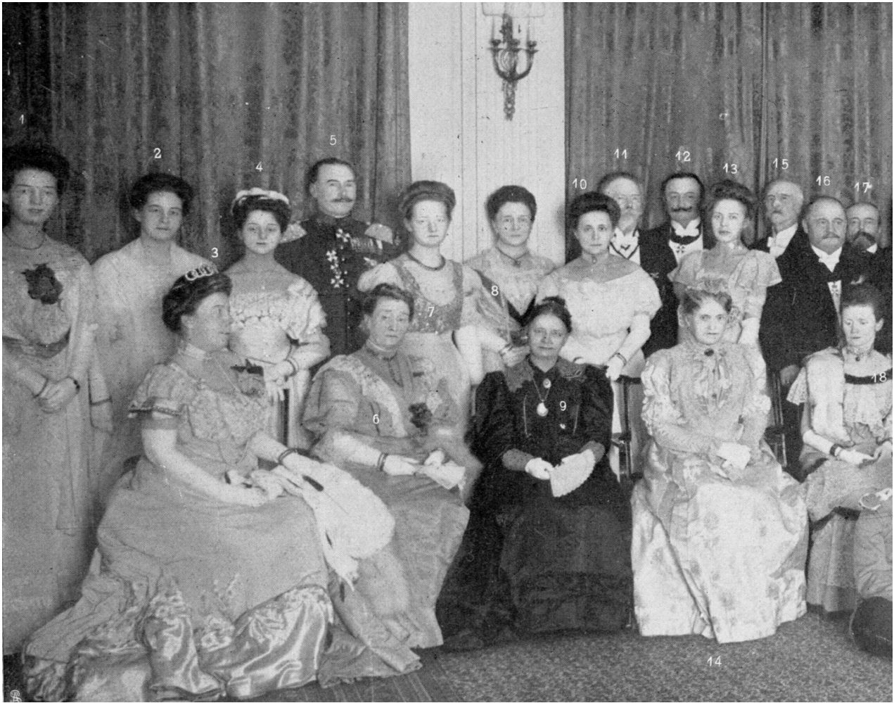
Der Familientag derer von Kleist in Berlin 1908